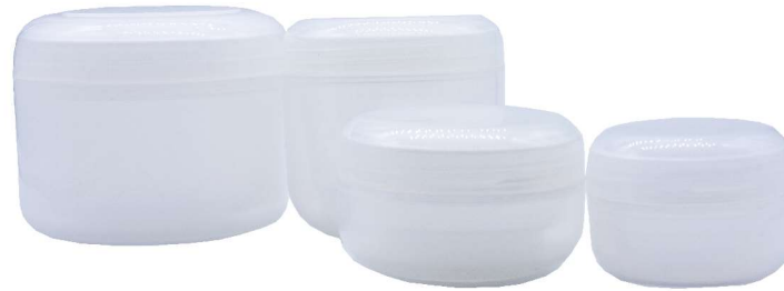
Tarro Blanco con Tapa y Linner Separado